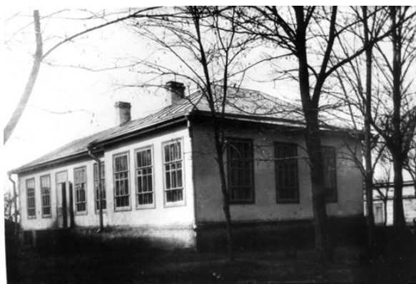
1927. Дом горянки – часть старого здания Тахтамукайской больницы.

В эти годы в Адыгее, как и по всей стране, организовывались женские дома. Первый